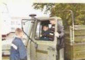
421 водитель категории «В» и «С»