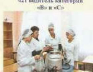
78 операторов машинного доения коров